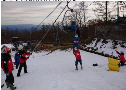
【冬季勤務前救助訓練】