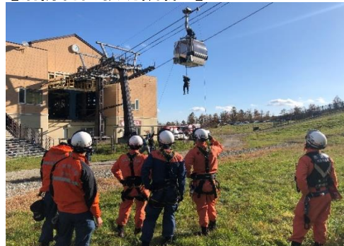
【消防合同救助訓練】